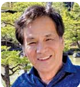
理事 求人教育副委員長

理事、経営労働委員として経営指針を毎年更新、実行。皆さんと学んだことを実践して、良い会社、良い経営者をめざします。