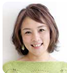
理事／女性部委員長 松山支部第3地区会副地区会長

清く正しく朗らかに。また良い一年を積み重ねられるよう、頼り頼られ生きていきたいと思ひます。良い人に囲まれ幸せな人生です。