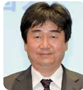
理事 南予支部幹事長

「地域づくり」を「企業づくり」と「同友会づくり」に直結させる取り組みを研究中です。 南予らしい支部を目指し頑張ります。