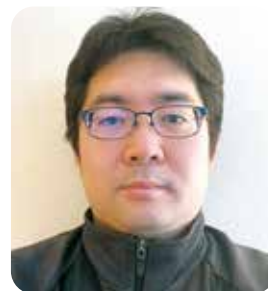
理事/青年部委員長 求人教育副委員長/総会実行委員長

①インタビューシップ「地域で若者を育て、地域に若者を残す!」運動 ②ワンシート経営指針成文化作成運動「小さな一流企業づくり」