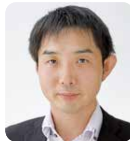
理事 経営労働副委員長

昨年度に引き続き経営指針セミナーの運営に尽力して参ります。よろしくお願いいたします。