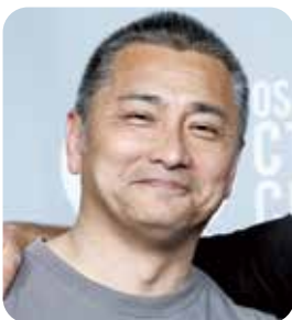
理事 松山支部第2地区会幹事長

今と、これから未来へ繋げるため「一期一会」を大切に、「堅忍不拔」の志をもって企業経営と同友会運動を実践しています。