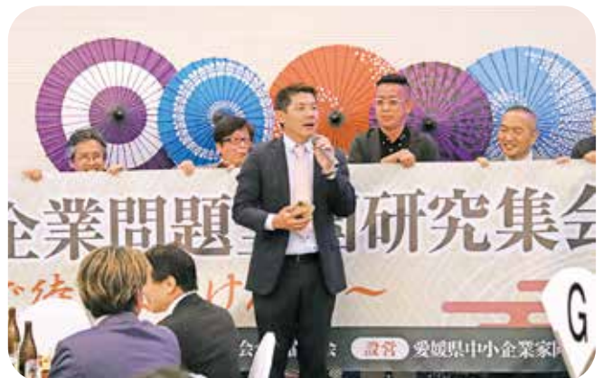
全研 in 愛媛のアピール(懇親会)