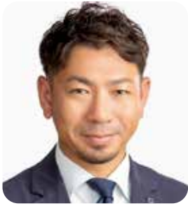
理事 伊予・松前支部副支部長