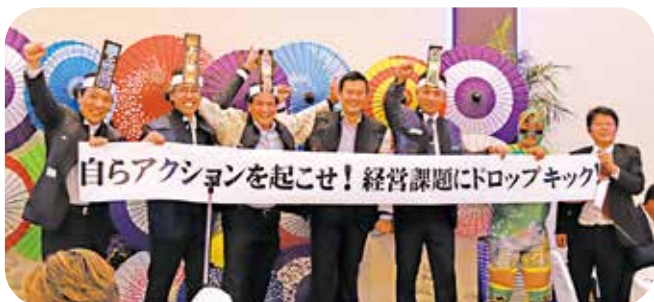
経営課題にドロップキック!(懇親会)