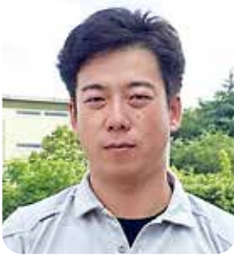
理事／松山支部第1地区会幹事長 経営労働副委員長

何を学ぶかより、誰と学ぶか。それはとても重要なことだと思ひます。同友会にはそんなこの人と学びたいと思える「誰と」がたくさんいる場だと考えています。