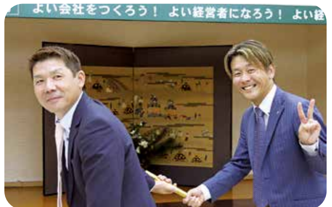
全研のバトンタッチ