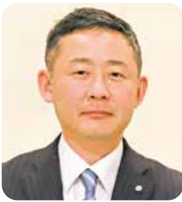
理事／松山支部幹事長 松山支部第2地区会長

今年度から松山支部第3地区会長となりました。幹事の皆さんと協力しながら、同友会の学びや様々な活動を楽しむことができるような第3地区会にしていきたいと思ひます。