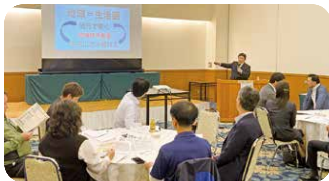
レクチャーの様子