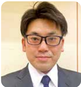
理事 経営労働委員長

昨年4月のペレット工場火災からの復旧が一段落つきました。同友会の仲間にも励ましをいただき、ありがとうございました。これからがんばります。また南予支部で、内子バイオマス発電所の見学例会を予定しています。