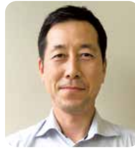
理事／松山支部副支部長 松山支部第3地区会長

希望ある地域づくりと全研 in 愛媛の成功に向けて頑張ります。皆さん宜しくお願いします。