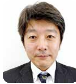
理事 伊予・松前支部幹事長

昨年度は、例会に数多くのゲストをお呼びすることができました。その結果、活気のある例会が開催され入会につながったと思います。今年度も、伊予・松前支部張り切って いーよ!