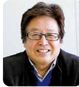
理事 松山支部第2地区会副地区会長

松山支部第1地区会、経営労働委員会、青年部委員会を盛り上げていきます！そして、愛媛同友会、愛媛経済の活性化に貢献できるようがんばります！今年も楽しく学びましょう！