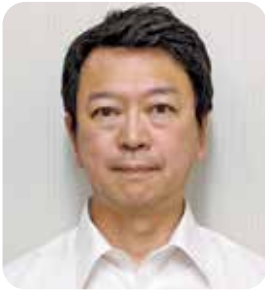
理事／松山支部長 松山支部第1地区会長