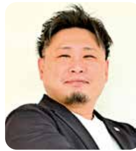
理事／松山支部第1地区会副地区会長 青年部副委員長

久しぶりの理事復帰となりますが、今年は全研 in 愛媛に向けて松山支部を盛り上げ活性化につなげていきたいと思ひます。