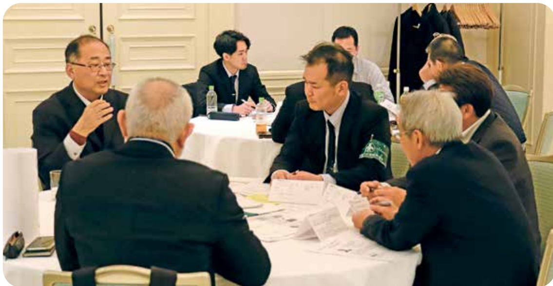
討論テーマは「地域から必要とされる仕事とは？」