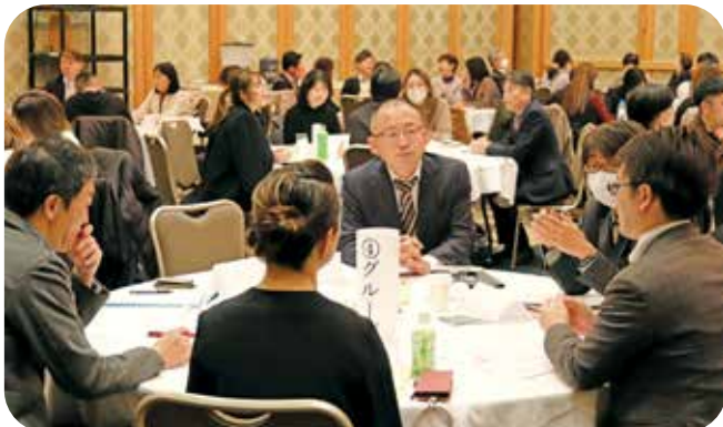
今日の報告でどんなヒントを得ましたか？