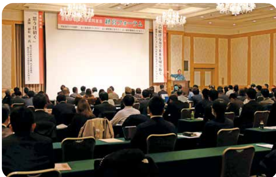
引きこまれるような講演でした