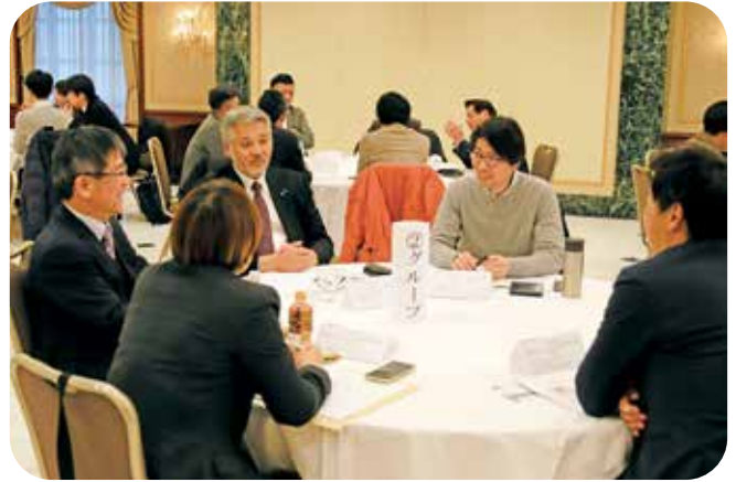
自社の人材育成の取り組みは？

ことに取り組んでいますか？また、その人材育成を通して、どのような未来を思い描いていますか？」というテーマのもと、各グループで様々な議論が交わされました。各社での人材育成に対する考え方や具体的な取り組みを発表し合い、熱い議論が繰り広げられました。朝礼やコミュニケーションの取り方、技術指導、先輩・後輩の関り方など、各社での工夫や具体的な取り組みを情報交換し、自社の課題解決に繋がるヒントを得られる場になっていたように思います。