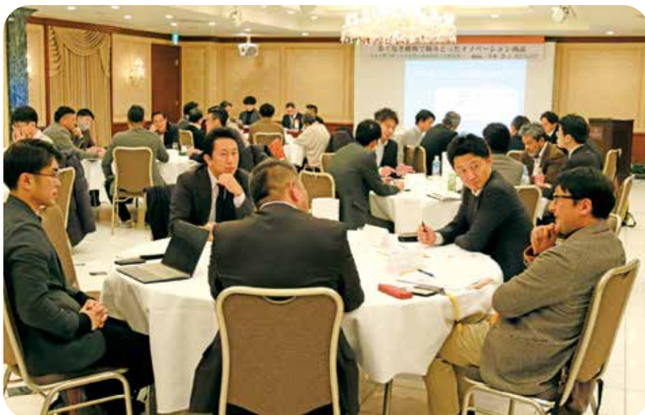
人材育成を通してどのような未来を描いていますか？