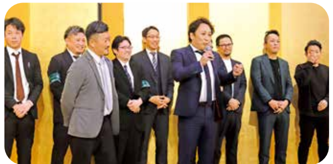
青全交 in 宮崎をPRする宮崎同友会と青年部の皆さん