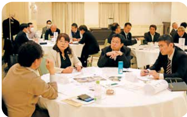
熱心なグループ討論

後半は、そこから決意して経営再建をされた話でした。同友会の学びを通してどうやって再建をしていったか、具