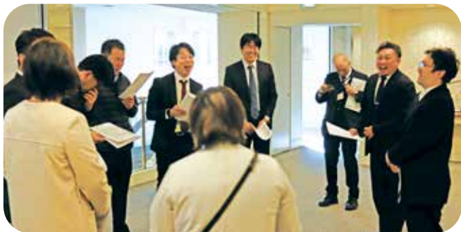
当日朝の実行委員会ミーティング