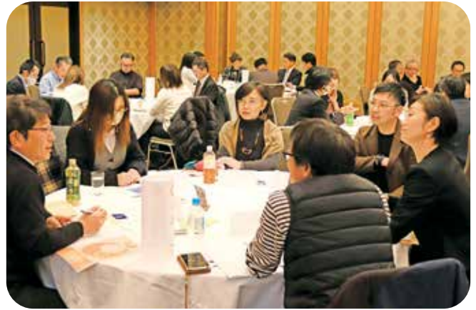
明日から何を実践しますか？